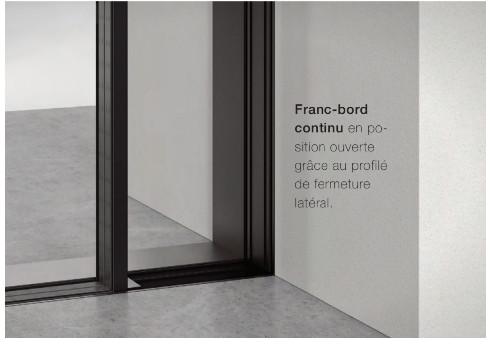
Franc-bord continu en position ouverte grâce au profilé de fermeture latéral.

Commande électrique Protection anti-insectes Triple vitrage pour profondeur de bâtiment de 60 mm maxi Indice d'affaiblissement acoustique : 47 dB