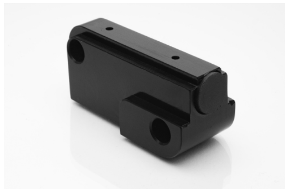
Komponente für die Highend-Schiebefenstersysteme.

Der SBU steht für die hochwertigen Arbeiten ein moderner Gerätepark zur Verfügung: CNC-Dreh- und -Fräsmaschinen, eine Stanz- und diverse Beistellmaschinen wie eine Tischbohr- und eine Bandschleifmaschine, eine Reinigungsanlage und eine Tischdrehbank. Dank dem bestens ausgerüsteten Maschinenpark kann die SBU Aufträge in kleinen,